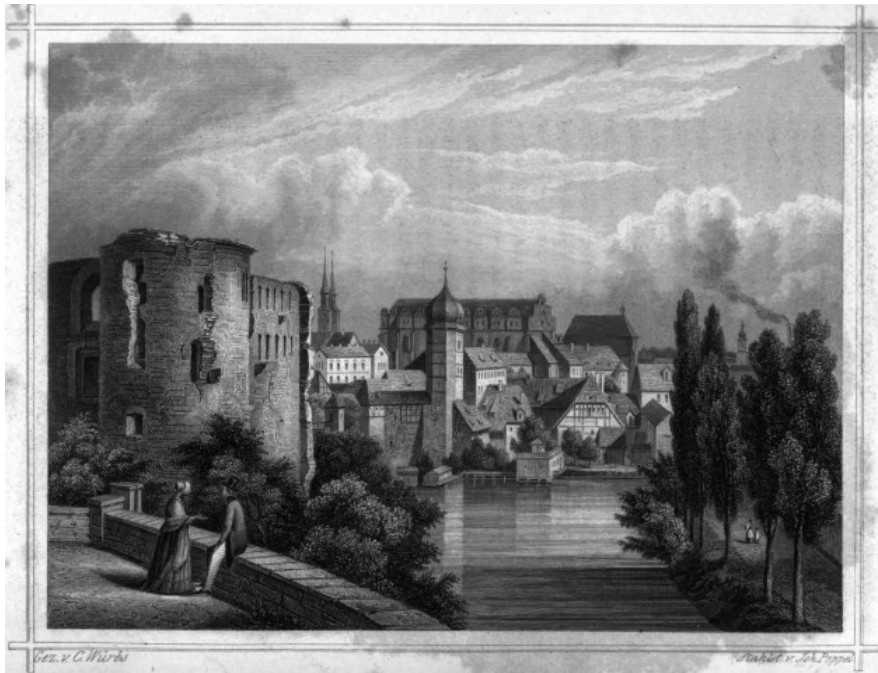
MORITZBURG UND DOMKIRCHE IN HALLE.